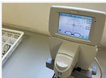
1本ずつ度数を測定

(2) ライオンズ眼鏡リサイクル・センターに届いたメガネは洗浄され、度数の確認が行われます。準備が終わったメガネは、リサイクル・センターのボランティアが丁寧に梱包し、メガネの配布活動で必要となるまで保管します。