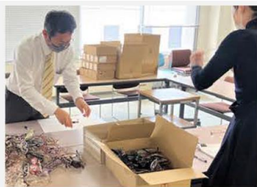
眼鏡店からHOYAへメガネが到着

(1) 各眼鏡店で回収したメガネを HOYA の各営業所で HOYA 社員が丁寧に仕分けし、提携のライオンズクラブを通じてライオンズ眼鏡リサイクル・センターへ発送します。