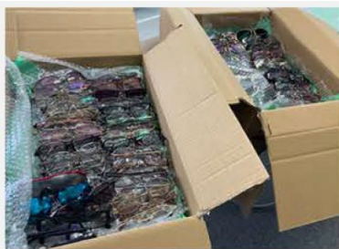
破損などがいないかを確認し、ライオンズへ発送

(2) ライオンズ眼鏡リサイクル・センターに届いたメガネは洗浄され、度数の確認が行われます。準備が終わったメガネは、リサイクル・センターのボランティアが丁寧に梱包し、メガネの配布活動で必要となるまで保管します。