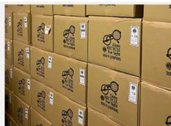
度数別・サングラス・子供用など用途別に仕分けて保管

(3) 世界のメガネを必要とする子供や大人に適切なリサイクルメガネを無料で提供します。主にメガネが必要とされる病院や学校への寄贈を予定しています。