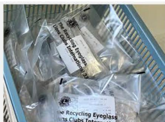
度数情報を書いた紙と一緒に丁寧に梱包