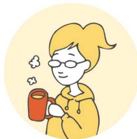
温かい飲み物を 飲もうとした時に…