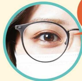
くもりにくいレンズ