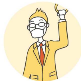
マスクを している時に…