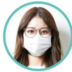
くもりにくいレンズ