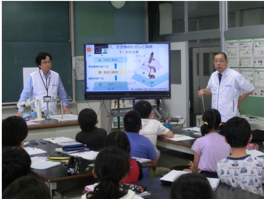
小学校での授業の様子

HOYAビジョンケアカンパニーでは、2016年4月から仙台市を中心とした宮城県内の小学校へ理科特別授業の企業講師として参画しています。このたびその貢献が認められ、仙台市教育委員会より感謝状が贈られました。